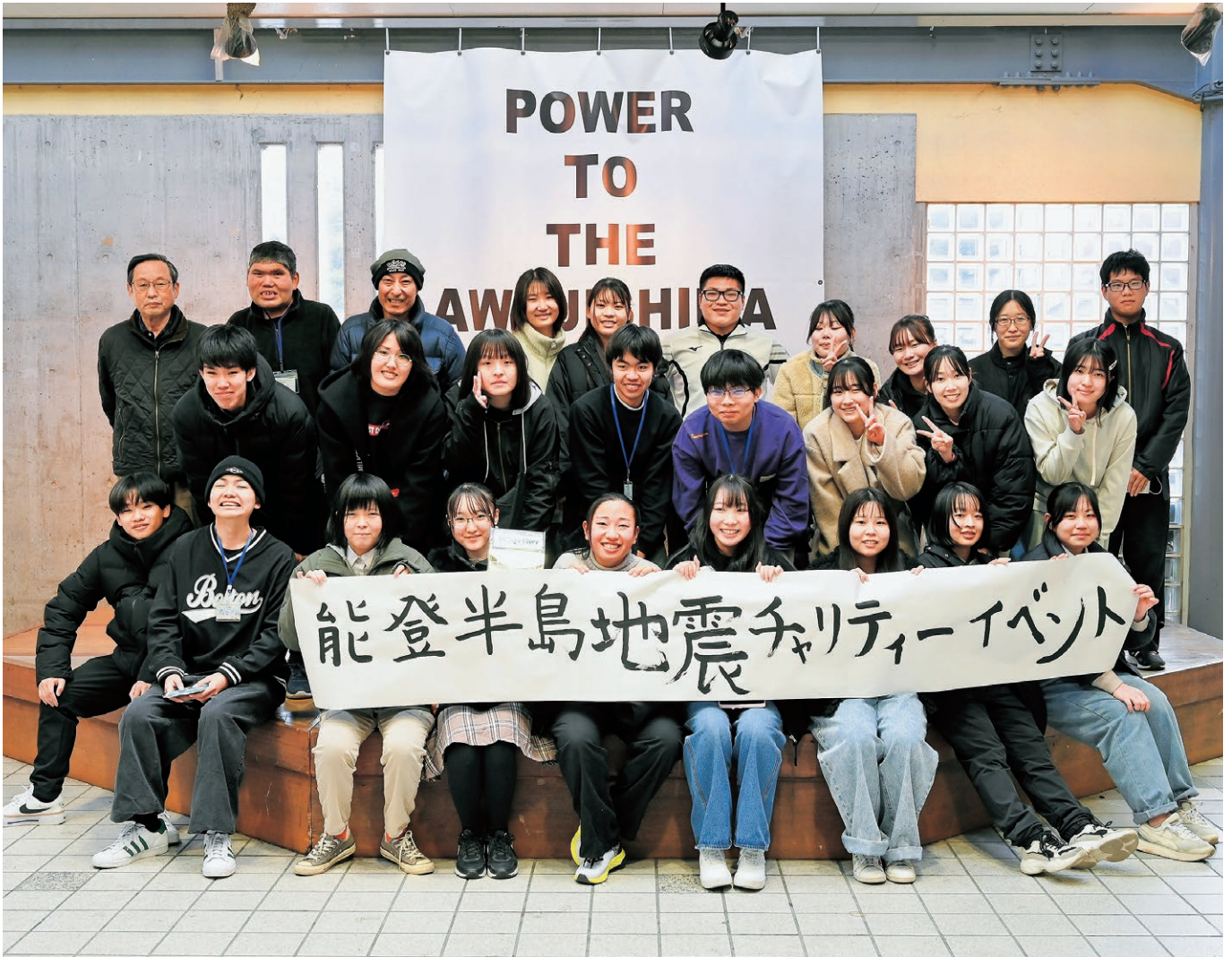
▲能登半島地震復興チャリティーイベント