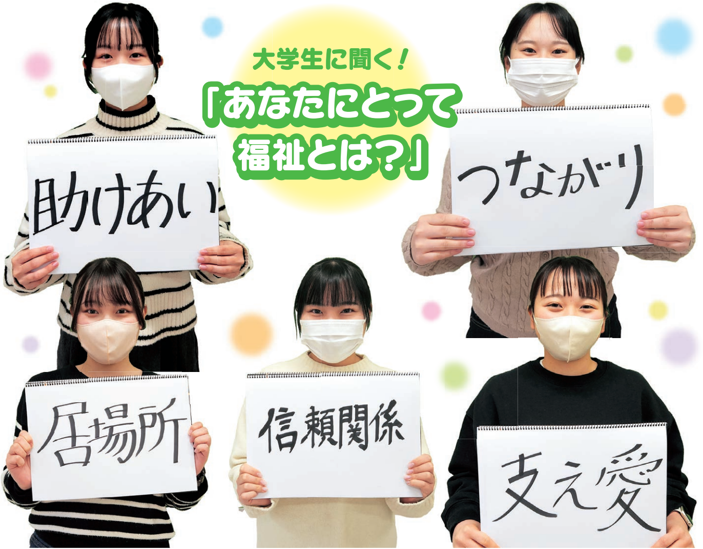
▲武庫川女子大学の実習生