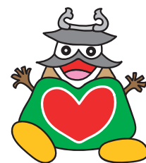
洲本市社協 キャラクター 「みつくマン」